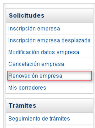
1. Enlace "renovación empresa"

La aplicación solicitará los datos identificativos de la empresa (Fig 2).